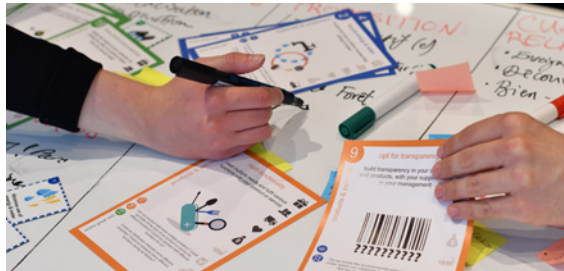
Opleidingen voor coaches in de Resilience Coaching-methodologie.

Het GPCE had in 2019 ook aandacht voor het hoger onderwijs. Bij 12 Franstalige en Nederlandstalige Brusselse instellingen voor hoger onderwijs werd gekeken naar het onderricht over circulaire economie. Daaruit kwamen grote verschillen naar voren in de bewustmaking voor duurzame ontwikkeling door die instellingen. Er zijn amper instellingen bij die hun studenten opleiden over circulaire economie. Dankzij die studie kon een reeks aanbevelingen gedaan worden voor de begeleiding van die instellingen. Daar zal rekening mee gehouden worden bij de volgende acties van het GPCE.