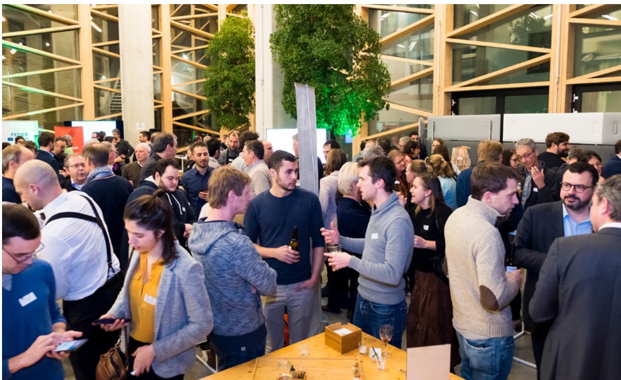
Het team van IRISPHERE ter gelegenheid van de Green Afterwork van IRISPHERE in Greenbizz.

Het programma IRISPHERE , dat gefinancierd wordt door het EFRO, wil de ontwikkeling van de Brusselse circulaire economie bevorderen door synergieën tussen bedrijven te stimuleren. Dit jaar werden 22 instanties begeleid om hun circulaire projecten te realiseren en om partnerschappen met andere instanties aan te gaan. Dat is ook het geval bij BEFIMMO, dat het glas uit de WTC-torens hergebruikt, en bij het atelier Groot Eiland, dat verbonden is aan het MAD en dat meubels creëert op basis van gerecupereerd hout en metalen structuren.